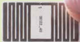
ECO Hook S UHFラベル 原寸大

Stora Enso社の目的は、再生可能資源で新しい製品やサービスを開発し、従来の再生不能資源を使用した製品からのシフトを実現することです。世界を変革することは私たち自身の絶え間ない変革でもあり、市場ニーズを満たしつつ原材料に関わる多くの困難を克服するため日々成長しています。紙資材、包装資材、パイオ材料、木造建造物など再生可能ソリューションのグローバルプロバイダーとして35ヶ国で26,000人の社員が活躍しています。Stora Enso社のインテリジェントパッケージング事業はIoTによるデジタルトランスフォーメーションを実現する製品やサービスをグローバルに提供しています。物理的アイテムにコネクティビティを与え、お客様の期待を超える効率や品質の向上と可視化を実現するソリューションです。